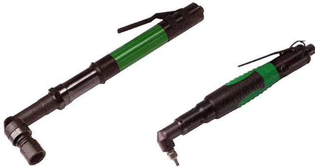
AG 40 RA